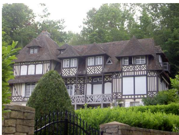
hameau dans Touville

Puis de nouveau une marche vers de splendides demeures au centre d'une verdure magnifique et d'un parfum délicat. Un témoignage très original de la part d'un homme amusant et sympathique, M. le Président de Trouville Culture.